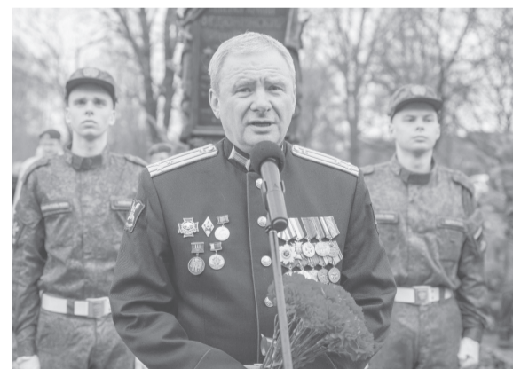
Сергей Петров, депутат Государственной думы РФ