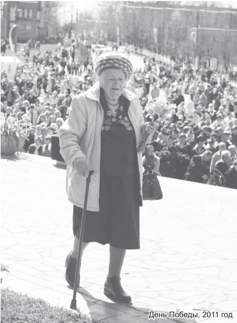
День Победы, 2011 год